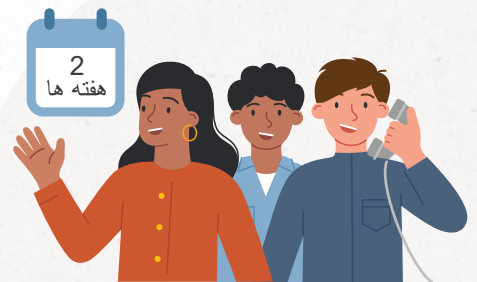
انجمن خارجی ها ثبت نام

یک انجمن باید بیمه مسئولیت تعهدات انجمن نیز داشته باشد. منطقی است که در مورد این موضوع به دنبال مشاوره باشید.